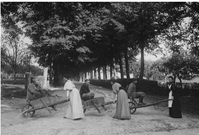
Vue de l'ancienne drève, fin XIX e siècle

Cela étant, quelle que soit la voie que vous emprunterez pour venir jusqu'à nous, nous serons ravis de vous accueillir car, nous, il ne nous viendrait jamais à l'idée de trouver avantageux d'être éloignés des "boues et des embarras" des villageois !